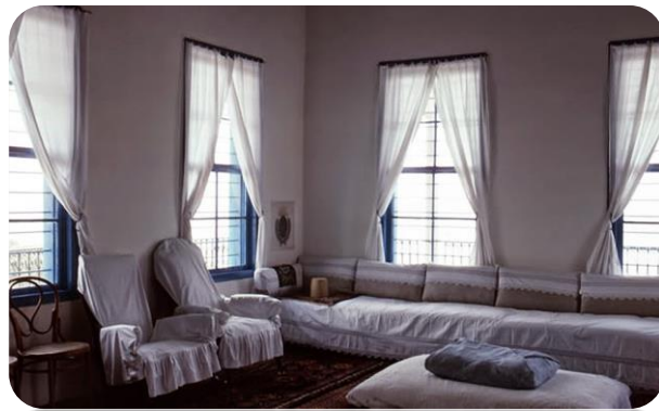
Комната Бахауллы в Доме Аббуда, Акка.

Невзирая на все это, Он ни на мгновение не прекращал возглашать величие Дела Бога. Он явил такие добродетели, знания и совершенства, что на Него дивились все люди Персии. Везде — и в Тегеране, и в Багдаде, и в Константинополе, и в Румелии и даже в Акке — ученые мужи и люди науки, как дружелюбно, так и враждебно настроенные, вступившие с Ним в общение, всегда получали наиболее полный и убедительный ответ на любой представленный на обсуждение вопрос. Все признавали, был единственным и неповторимым во всех совершенствах.