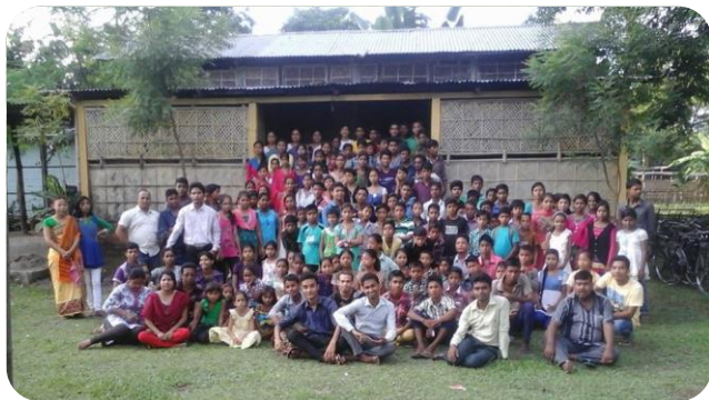
Кластер Наоката, Ассам, Индия. Молодёжь кластера