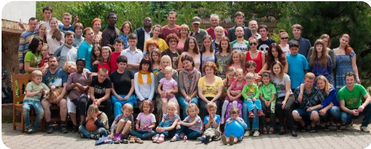
Участники семинара ISGP в Лужесно, Беларусь