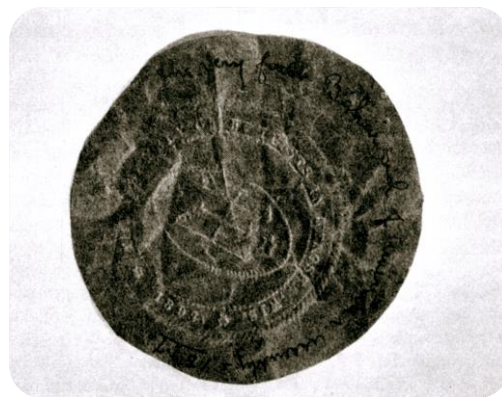
Интересно: печать первого Собрания США и Канады, 1897 год

http://en.wikipedia.org/wiki/Nipo_T._Strongheart